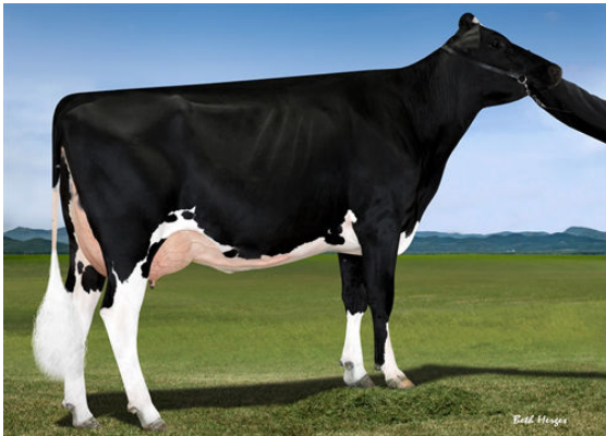
FAIRMONT TUFFENUFF RIDGE THIRD DAM