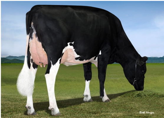
FAIRMONT TUFFENUFF RIDGE THIRD DAM